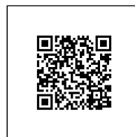
Zažádejte o vytyčení

GasNet, s.r.o. zastoupená společností GasNet Služby, s.r.o., IČ 27935311 Oto Valehrach DiS. Technik externích požadavků-Morava Oddělení zpracování ext.požadavků-Morava OTO.VALEHRACH@GASNET.CZ